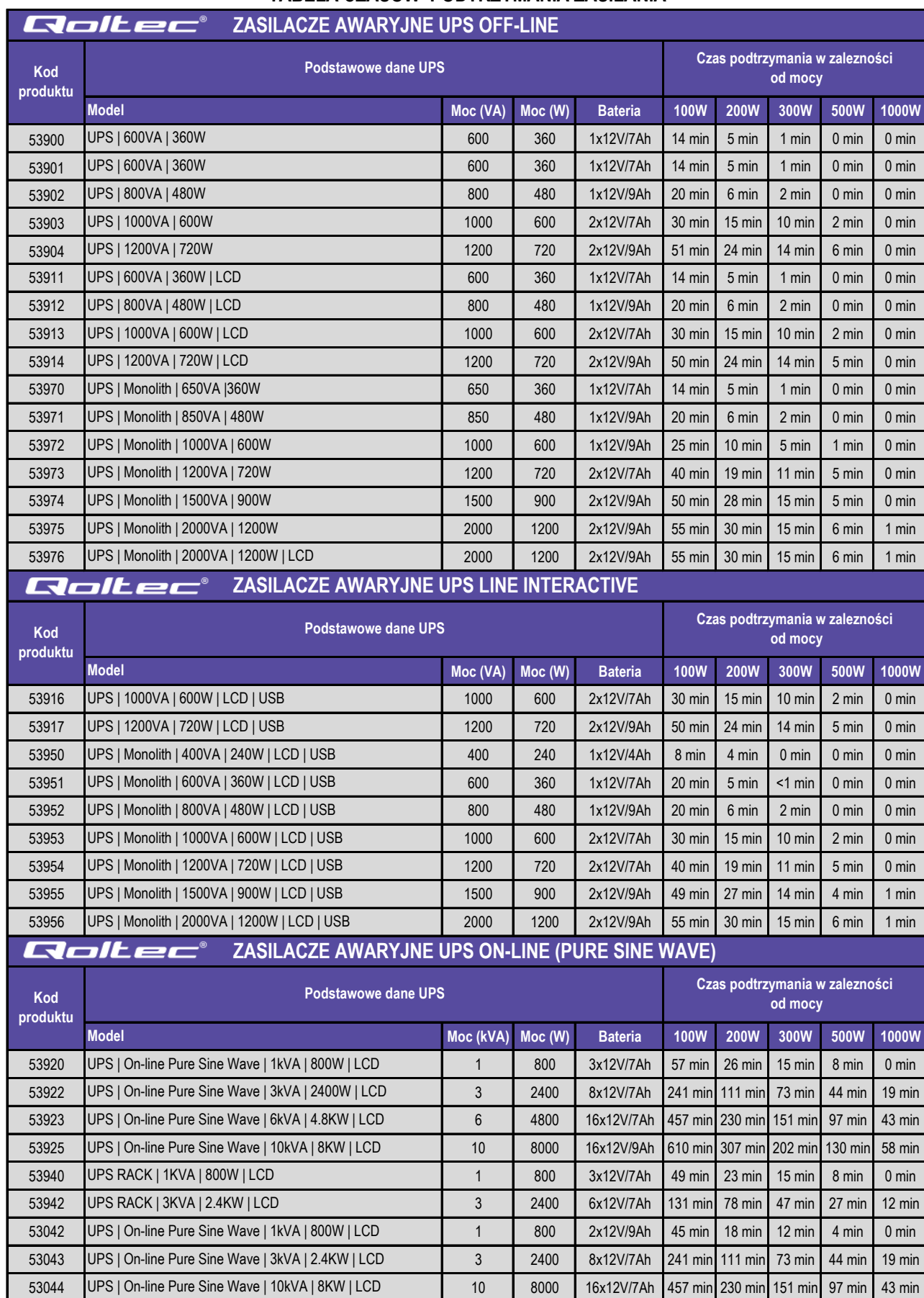
TABELA CZASÓW PODTRZYMANIA ZASILANIA

Podane czasy pracy są orientacyjne mogą ulec zmianie w zależności od warunków pracy, otoczenia, czasu eksploatacji i wielu innych.